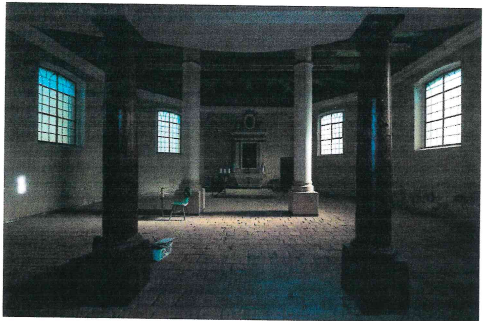
Fot. 3. Wnętrze kaplicy