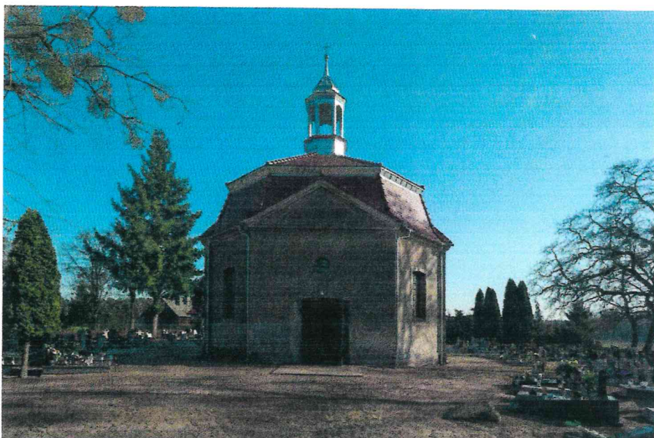
Fot. 1. Widok kaplicy