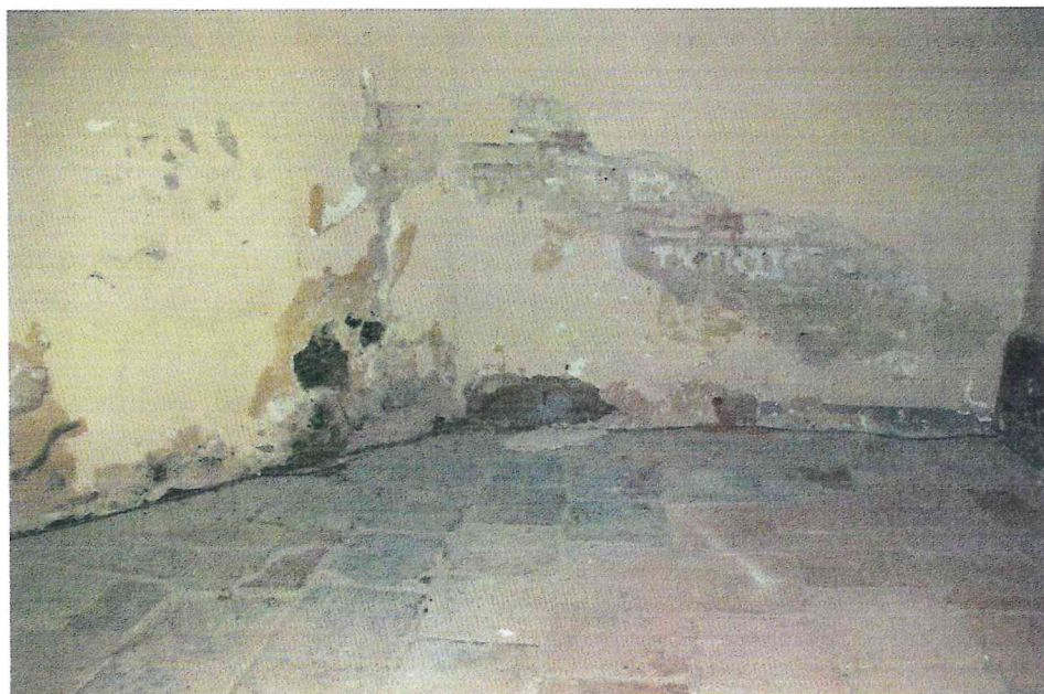
Fot. 5. Miejscowe porażenie biologiczne grzybem pleśniowym, zawilgocenie i krystalizacja soli