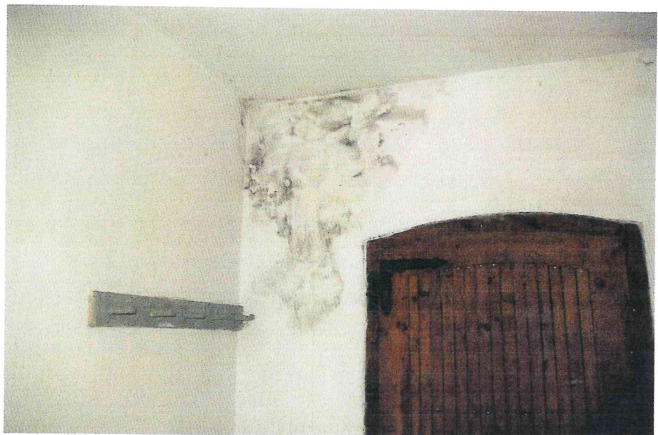
Fot. 4. Porażenie biologiczne grzybem pleśniowym